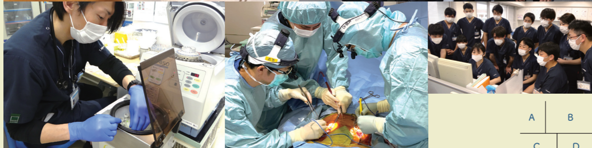
A. 病院外観 B. 研修風景 C. オリエンテーション D. 1年目研修医 E. 研修風景 F. 研修風景 G. 研修医室