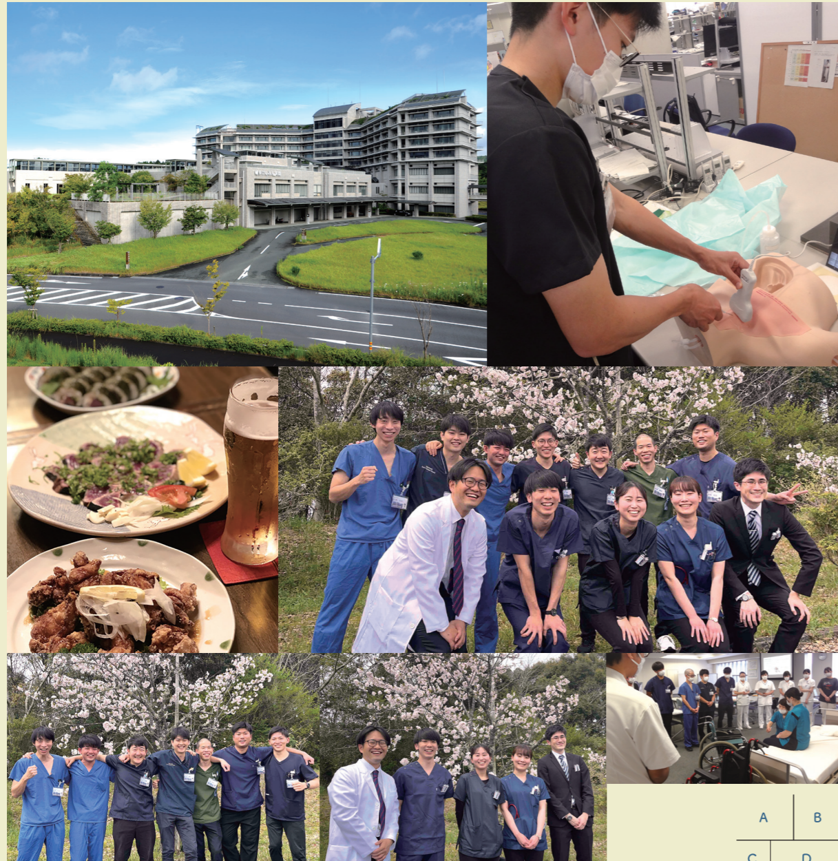
A. 病院外観 B. 手技練習中 C. 美味しいごはん D. 研修医集合 E. 2年目研修医 F. 1年目研修医 G. 多職種合同研修