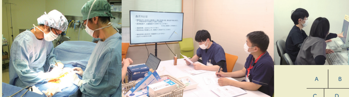
A. 病院外観 B. ほそぎハートセンター外観／ドクターカー・ナースカー C. 研修医オリエンテーション／上級医・2年目の先輩研修医にマンツーマンで教わります。少人数だからその行き届いた指導が受けられます。 D. 心臓カテーテル室 E. 外科研修中 F. 研修風景①／ただいま講義の真っ最中！真剣に聞いていますね。 G. 研修風景②／電カルとらめっこ中。「ここをクリックして…」先輩からのアドバイスが今日もさえわたってる～！