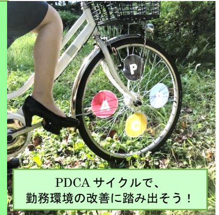
PDCA サイクルで、勤務環境の改善に踏み出そう！