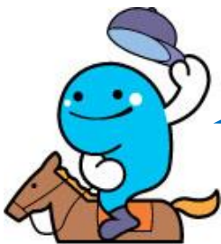
高知県イメージキャラクター「くろしおくん」

*2 か月平均, 3 か月平均, 4 か月平均, 5 か月平均, 6 か月平均の全てが 80 時間以内であること。